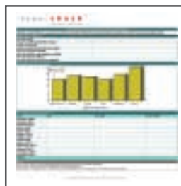
Esempio di report