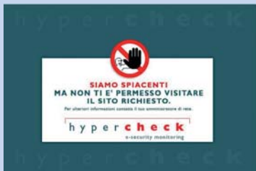
▲ Accesso negato

Individua le backdoor presenti sul sistema ed impedisce a terzi l'accesso alle informazioni contenute in azienda.